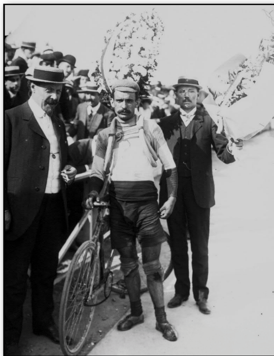
3. Gustave Garrigou, successeur de René Pottier au sommet du Ballon d'Alsace (Tour de France 1908).

Besoin de traduction ? Garrigou retrouve la forme et, en excellent grimpeur qu'il est, devrait être à son aise dans le Ballon d'Alsace. C'est bien simple : s'il ne tombe pas dans