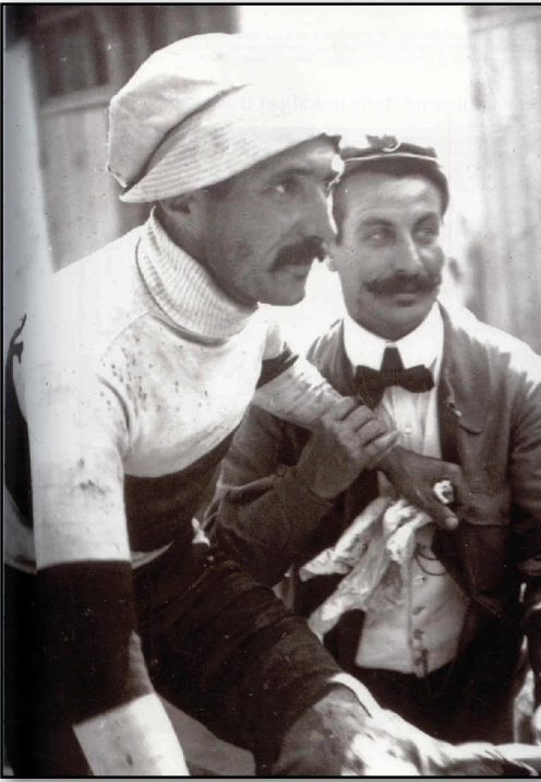
10. René Pottier pendant le Tour de France 1906.

« Si ma guigne légendaire veut bien m'abandonner. »