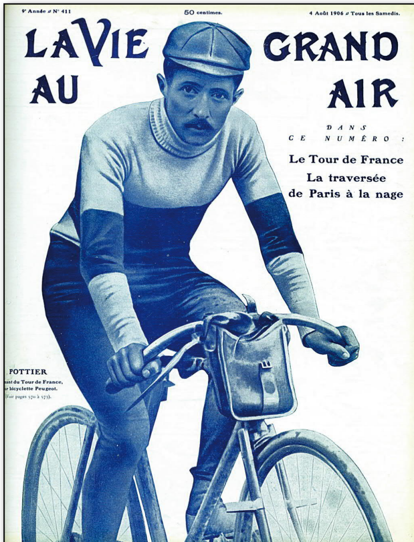
16. René Pottier fait la une de La Vie au Grand Air après sa victoire dans le Tour de France 1906.