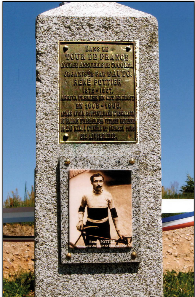
5. Stèle actuelle au sommet du Ballon d'Alsace.

Elle en a vu passer des cyclistes, cette stèle, et en voit encore. Mais le premier d'entre eux, à tout jamais, reste Gustave Garrigou. En somme, Georges Passerieu avait raison dans ses prédictions. Et tant pis pour lui, qui n'a pas pu tenir ses promesses. Handicapé par une chute, bien avant le Ballon d'Alsace, il grimpe