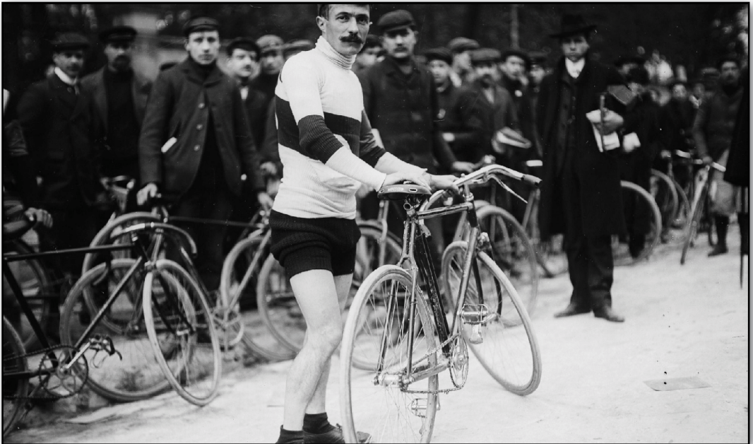
7. René Pottier pendant le Tour de France 1905.

À Saint-Maurice, les six hommes de tête sont attendus par des membres de leur équipe, qui leur ont préparé des bicyclettes à petite multiplication, plus appropriées pour affronter les rudes pourcentages de la côte. Tous repartent ensemble, à l'exception de Petit-Breton qui, mal servi par l'un de ses aides, perd du temps, « 100 mètres qu'il ne pourra plus combler tant le départ des autres a été