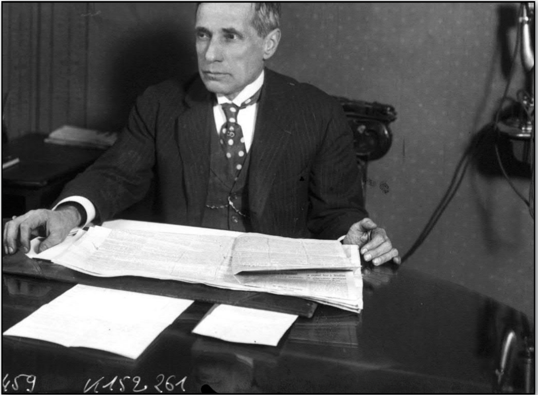
4. Henri Desgrange, ici en 1914, est le créateur du Tour de France.

sont bientôt des importuns » 11 , se lamente-t-il. Il entend trouver comment « perpétuer le souvenir de Pottier, qui fut pour nous tous un exemple de courage et de volonté. » 12 C'est l'ère du temps, aussi, que de proposer à la jeunesse des sujets à vénérer.