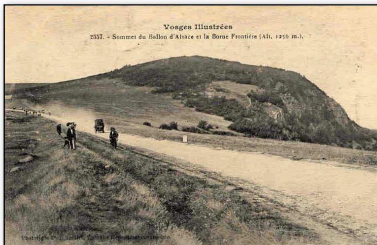
6. Vue générale du sommet du Ballon d'Alsace, au début du XXe siècle.