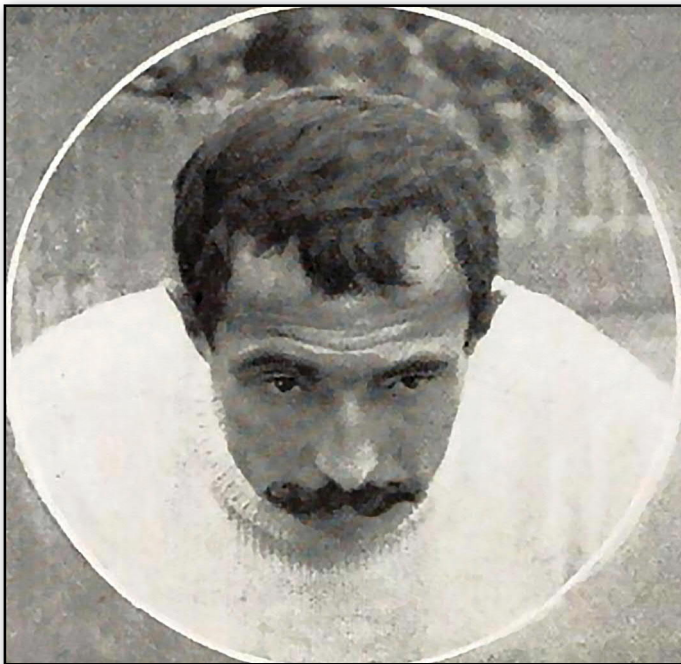
9. Photo en médaillon de René Pottier, parue dans La Vie au Grand Air , en 1906.